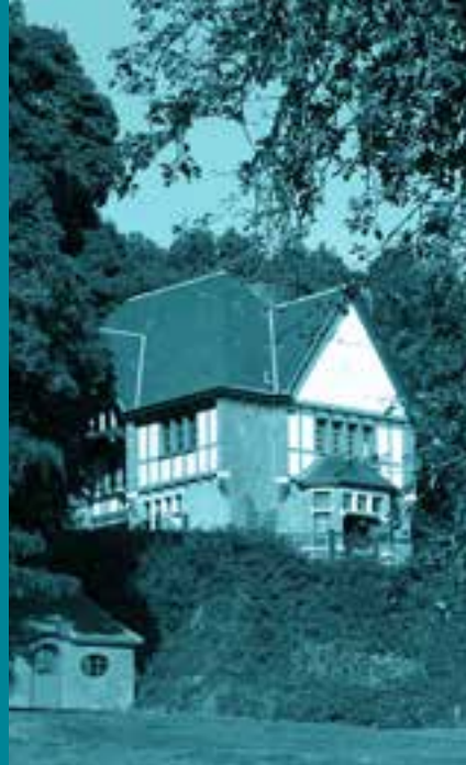
LA VILLA DÉPARTEMENTALE MARGUERITE YOURCENAR

La participation à ce concours implique l'acceptation complète de ce règlement. Le règlement peut être obtenu sur simple demande.