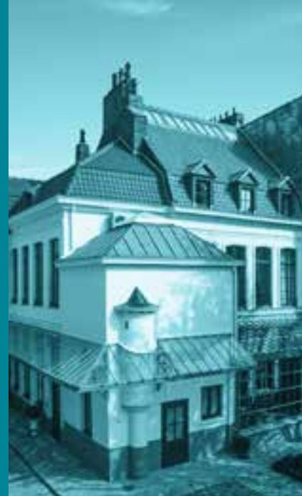
LA MAISON NATALE CHARLES DE GAULLE

La Maison natale Charles de Gaulle est un équipement culturel du Département du Nord. Le musée propose de découvrir la jeunesse et l'éducation de Charles de Gaulle.